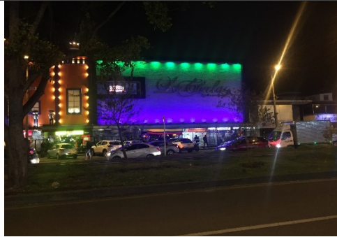
Fotografía panorámica de la fachada 2 del establecimiento de comercio denominado LA CHULA 116, el aviso de fachada no cuenta con registro de Publicidad Exterior Visual y contiene publicidad en pantalla LED.